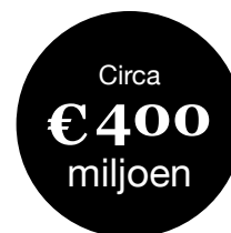
Pensioenuitkeringen over 2021