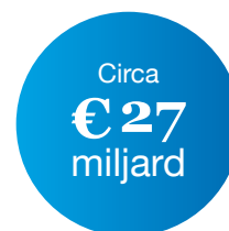
Pensioenverplichtingen over 2021