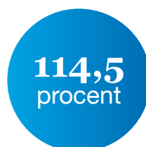
Beleidsdekkingsgraad eind 2021