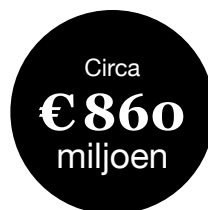
Ontvangen premie over 2021