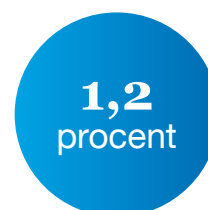
Beleggingsresultaat over 2021