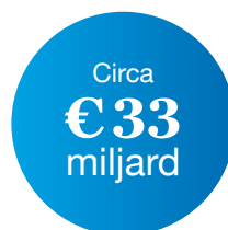
Pensioenvermogen eind 2021